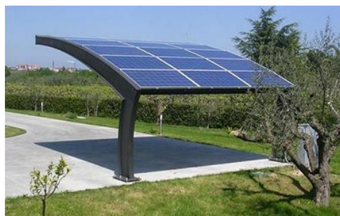
Figura6 esemplificativa cap port

6.3bis. I manufatti, di cui ai commi 5, 6.1, 6.2 e 6.3 del presente articolo, sono ammessi solo quali pertinenze di un edificio esistente o in corso di costruzione e sono comunque fatti salvi vincoli, autorizzazioni, pareri ed assensi quali quelli di tipo paesaggistico, idraulico, ecc..