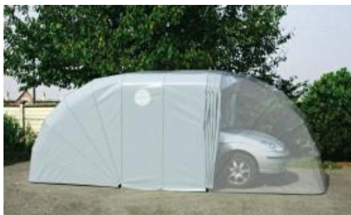
Figure esemplificativa: box tenda auto