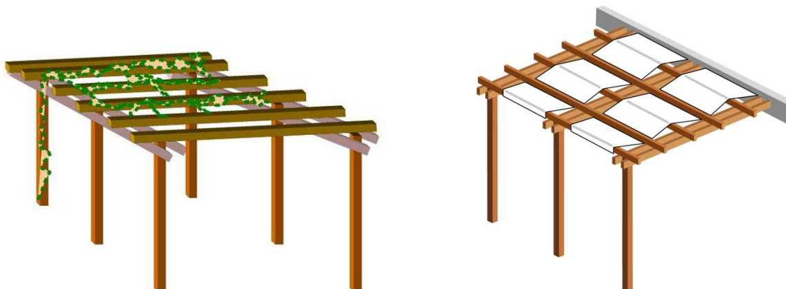
Figure: illustrazione grafica esemplificativa

Le cosiddette pergole con struttura a "brise soleil" (e/o frangisole), realizzate in legno o in acciaio, hanno la funzione di filtrare la luce del sole e di ridurre la radiazione su terrazze, balconi o verande, consentendo di godere di un ambiente fresco e ombreggiato.